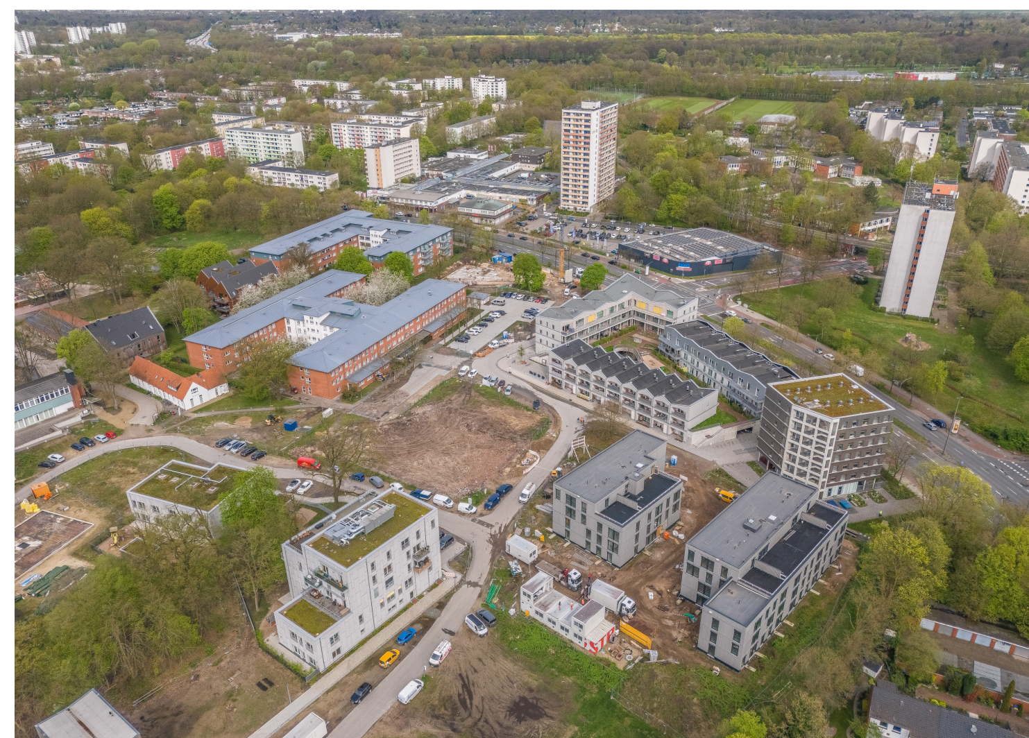
Nördlicher Teilbereich Ellener Hof, Stand 2024