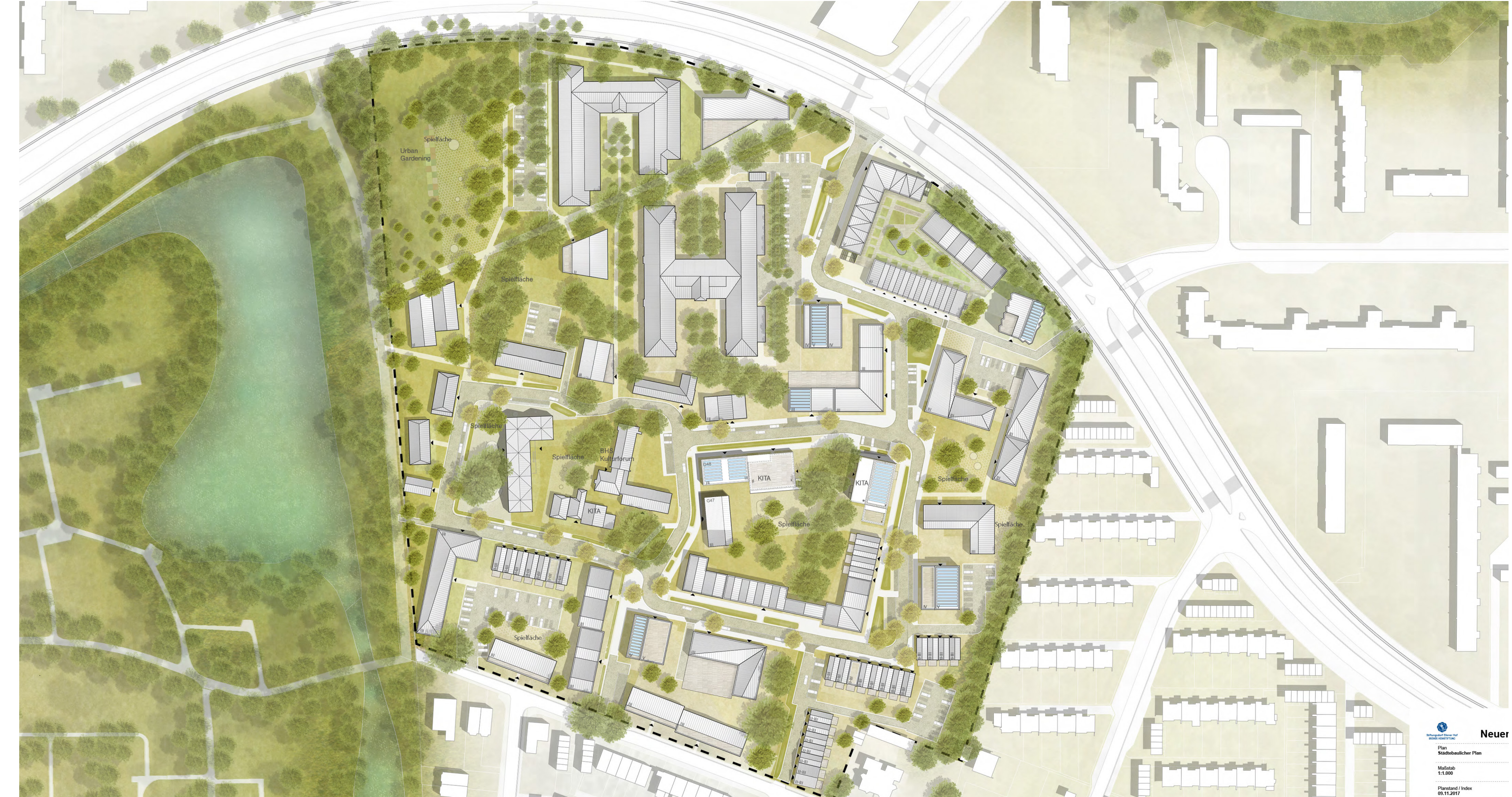
Städtebauliches Konzept "Ellener Hof" (DeZwarteHond, RMP SL Landschaftsarchitekten SBMS, Bremer Heimstiftung)