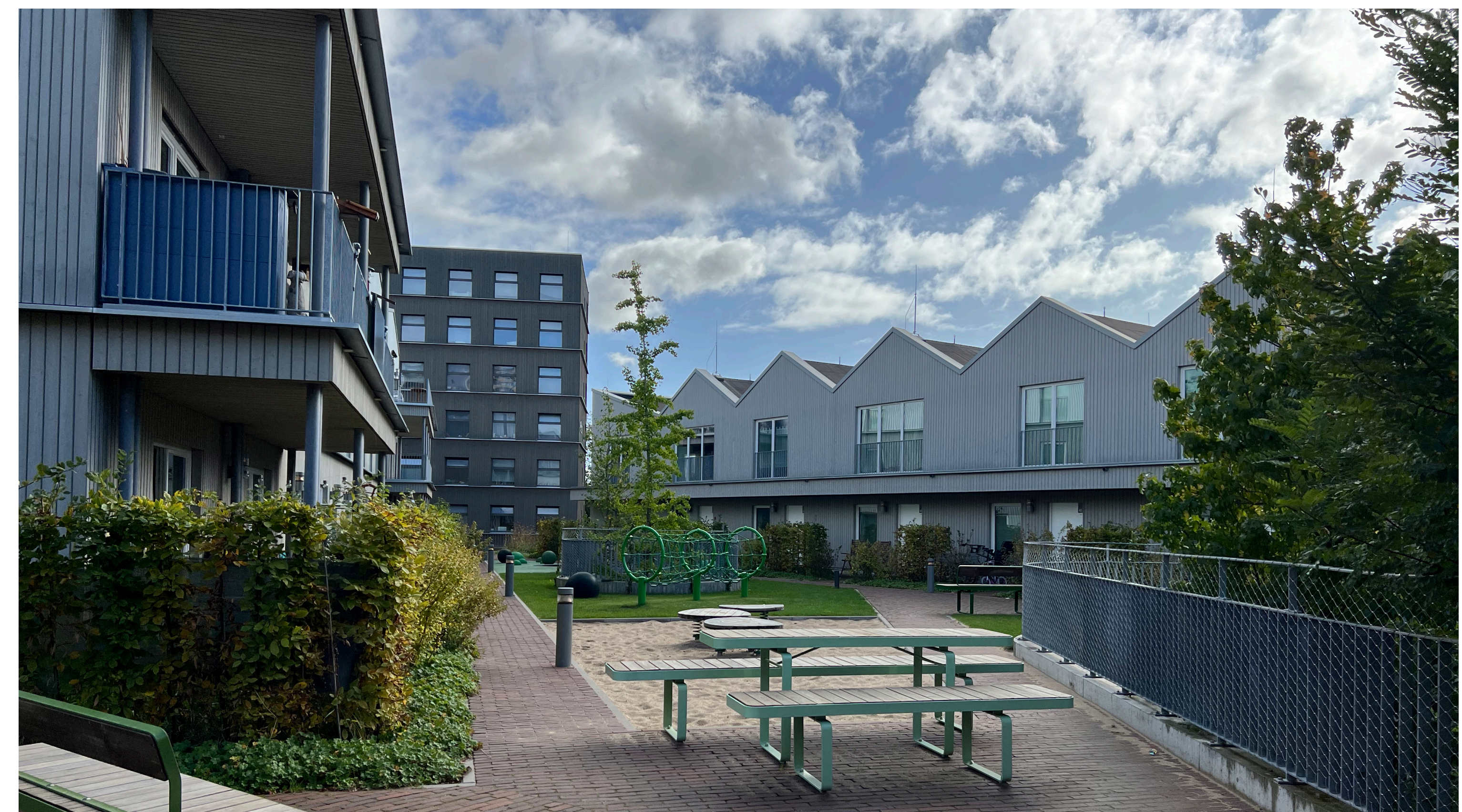
Erstes Baufeld an der Ludwig-Roselius-Allee