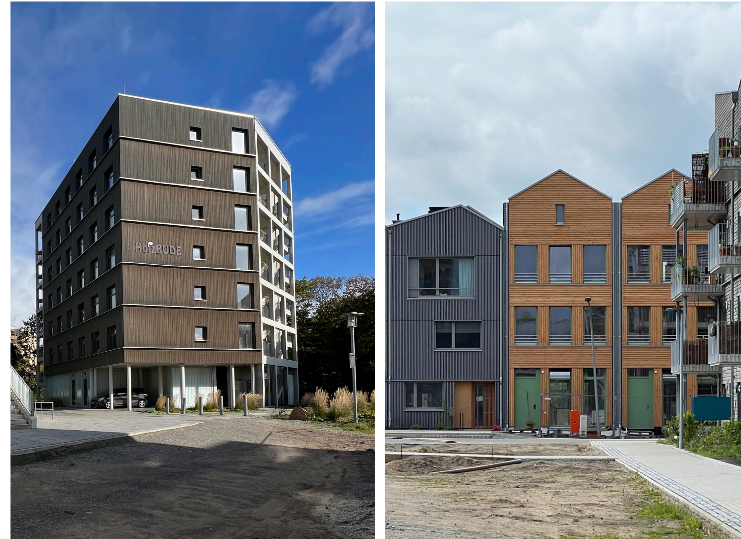
Neue Bremer Häuser und eine Baugemeinschaft