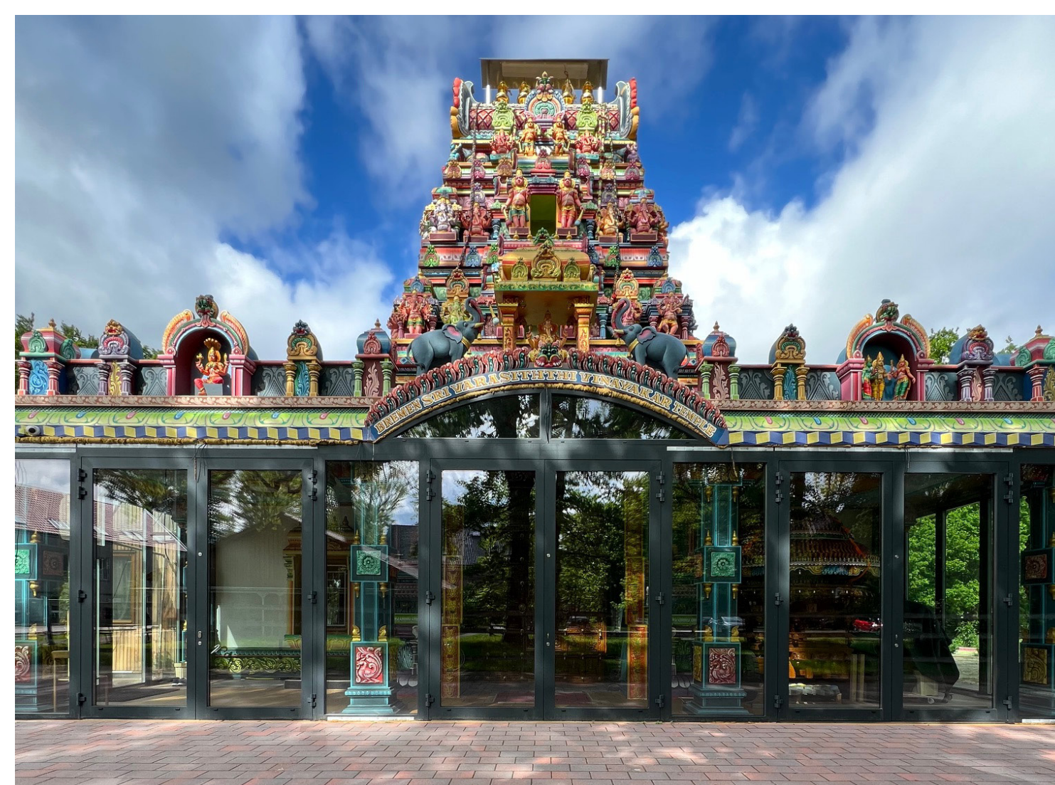
Hindu-Tempel Ellener Hof