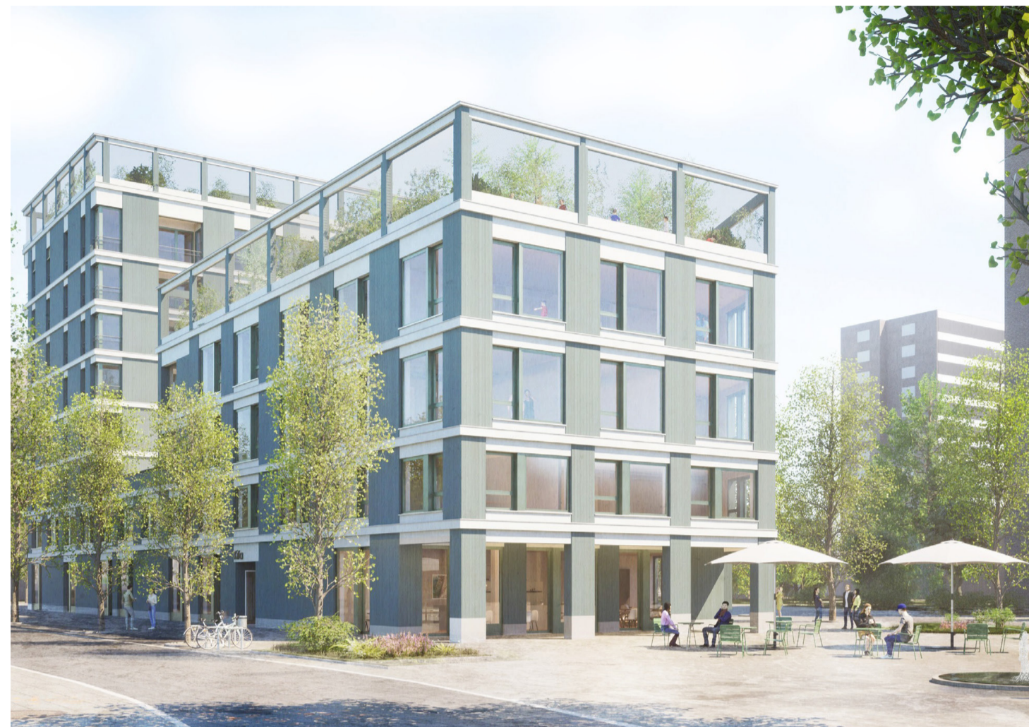
Geplanter Neubau eines Quartierszentrums der GEOWBA (Hild und K, München)