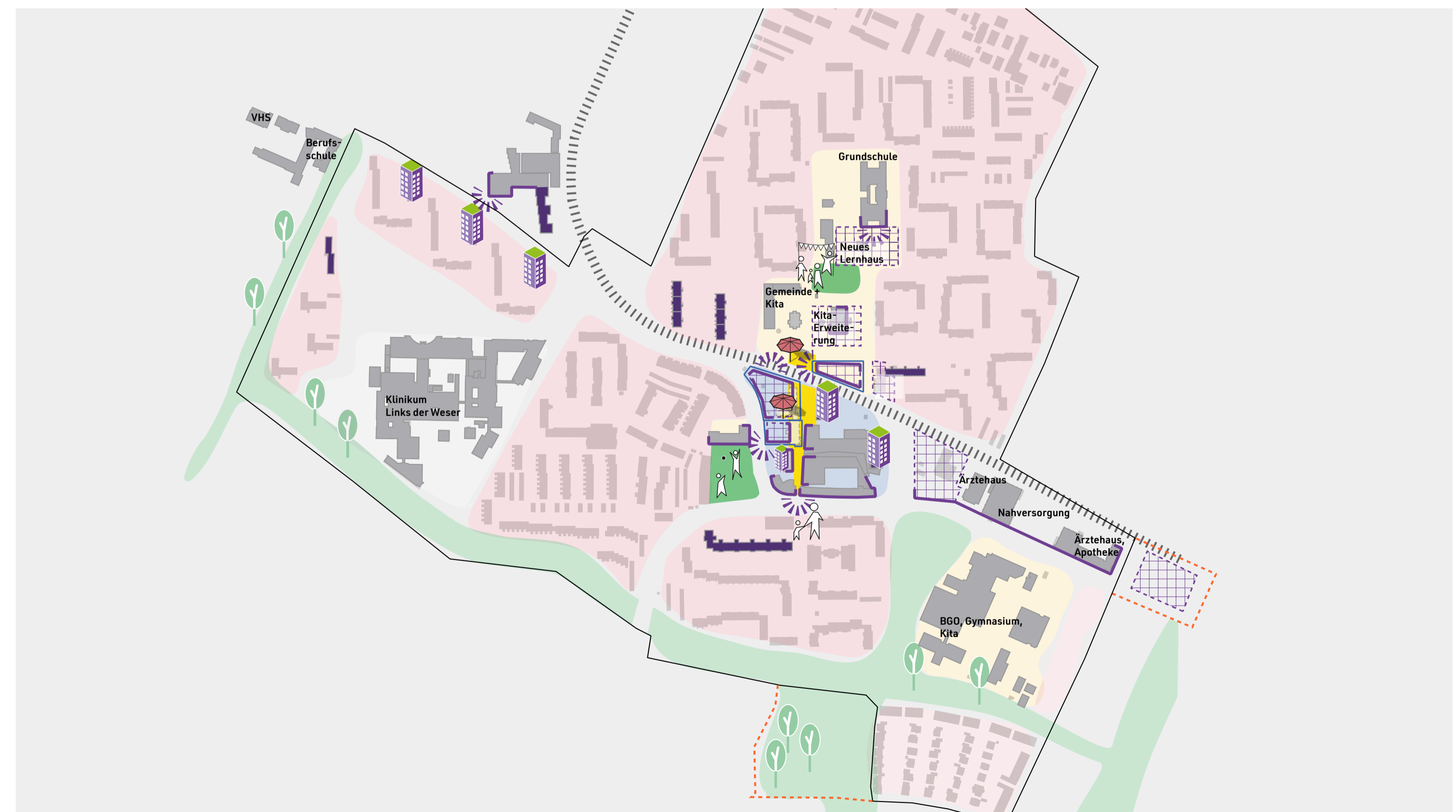
Rahmenplanung Zentrum Kattenturm (SBMS und BPW Stadtplanung)