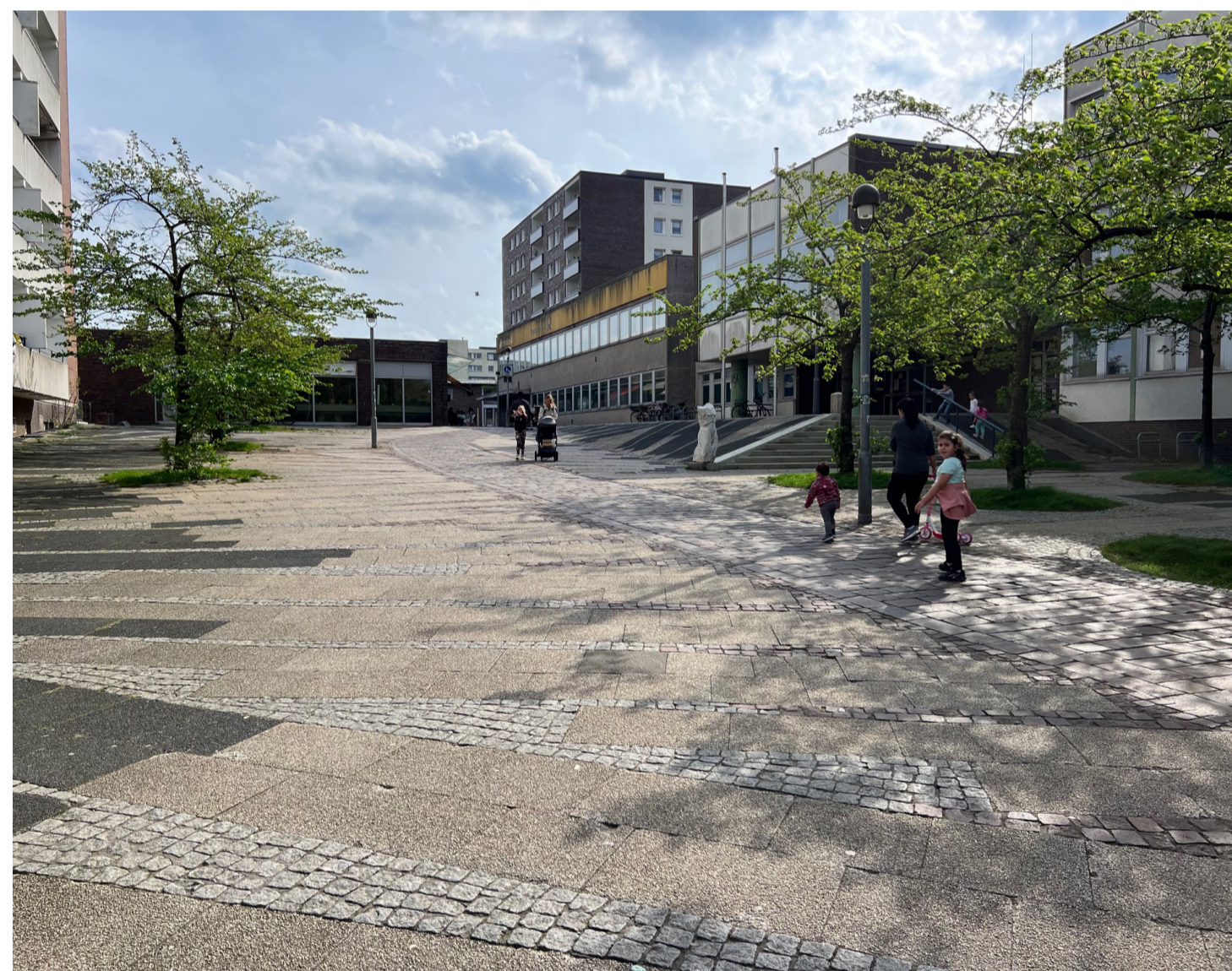
Eingangssituation Zentrum Kattenturm