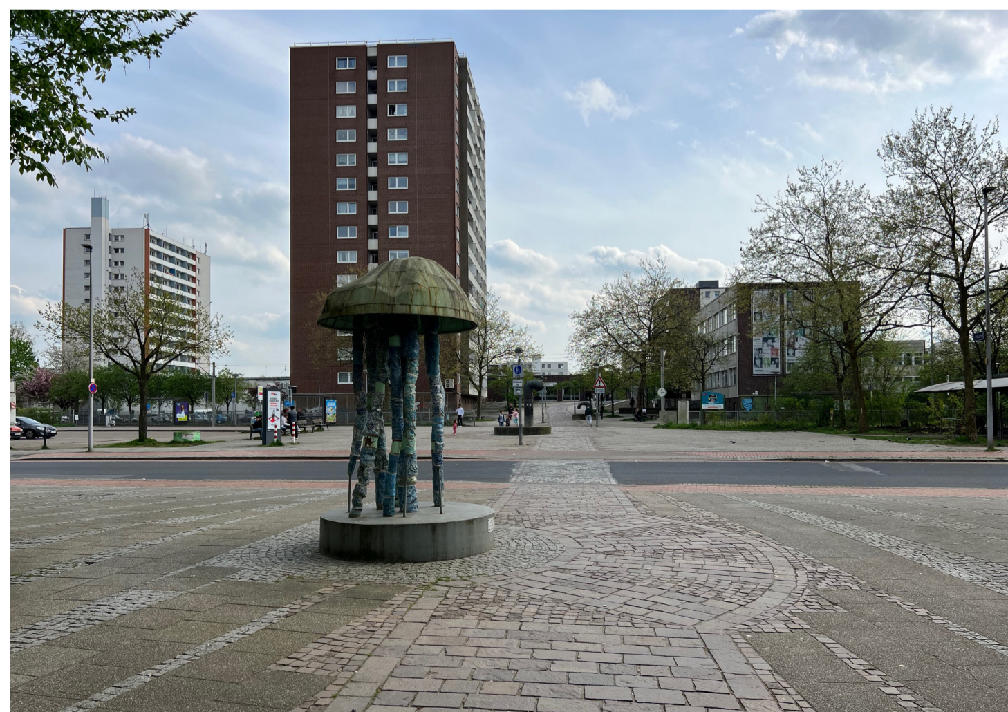
Öffentlicher Raum in Kattenturm-Mitte