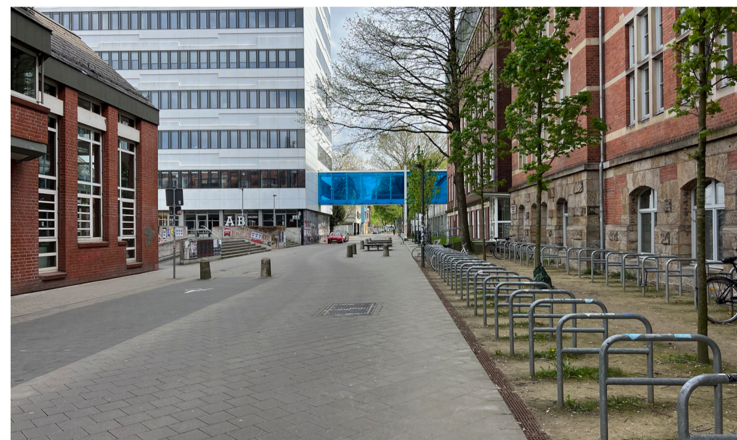
Umbau Neustadtwall im Bereich der Hochschule Bremen