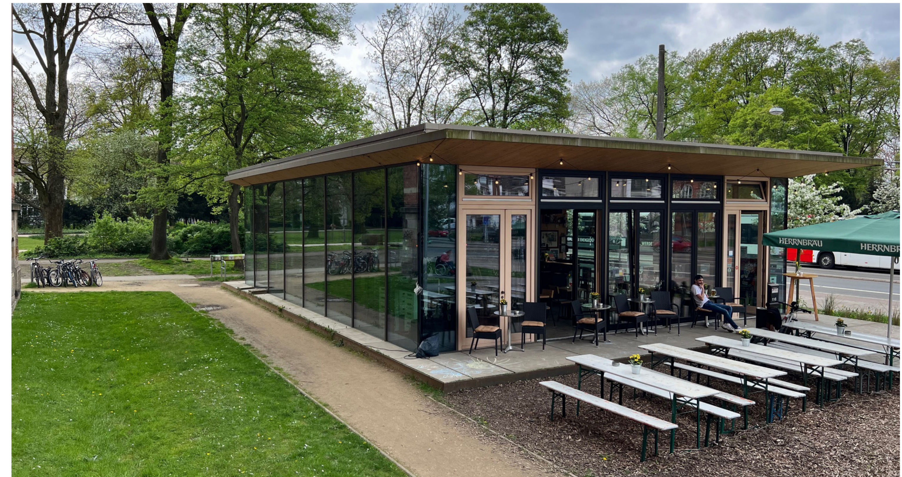
Fahrrad-Repair-Café Alte Neustadt