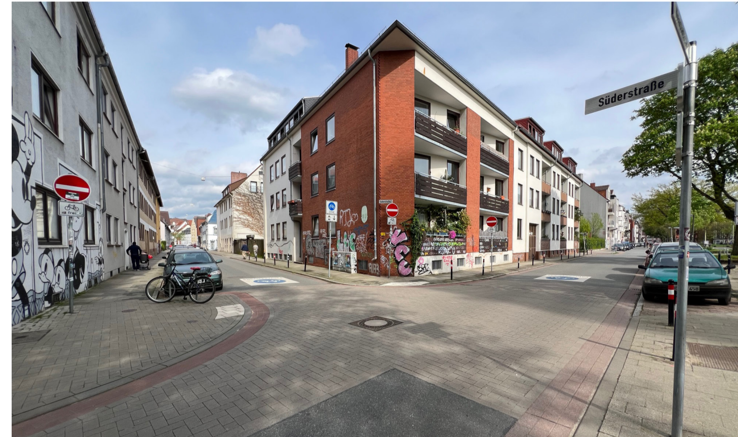
Umbau zu einer fahrradfreundlichen Straßenkreuzung