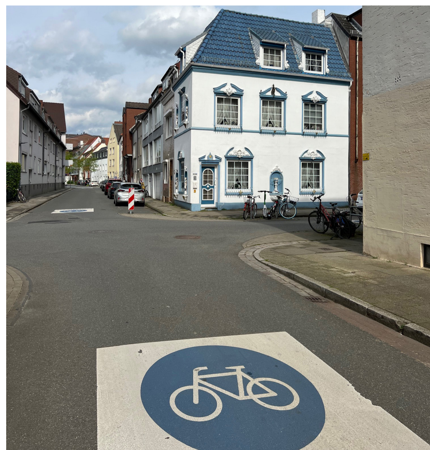
Stadtraum im Fahrradmodellquartier