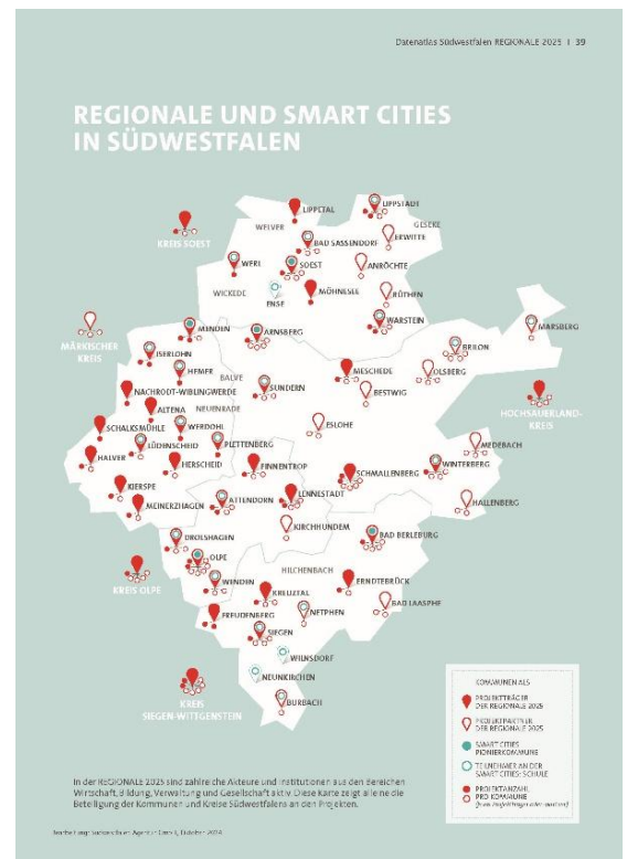
(Abbildungen aus dem Datenatlas Südwestfalen rechts Stand Herbst 2024)