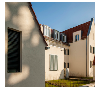
06 Neue Freiräume