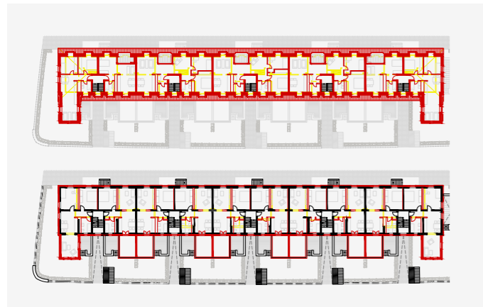
01 Grundrisse EG und OG