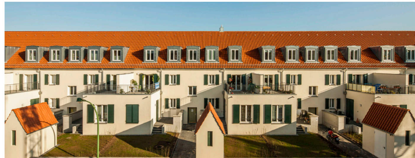
04 Straßenansicht mit Anbauten und Nebengebäuden