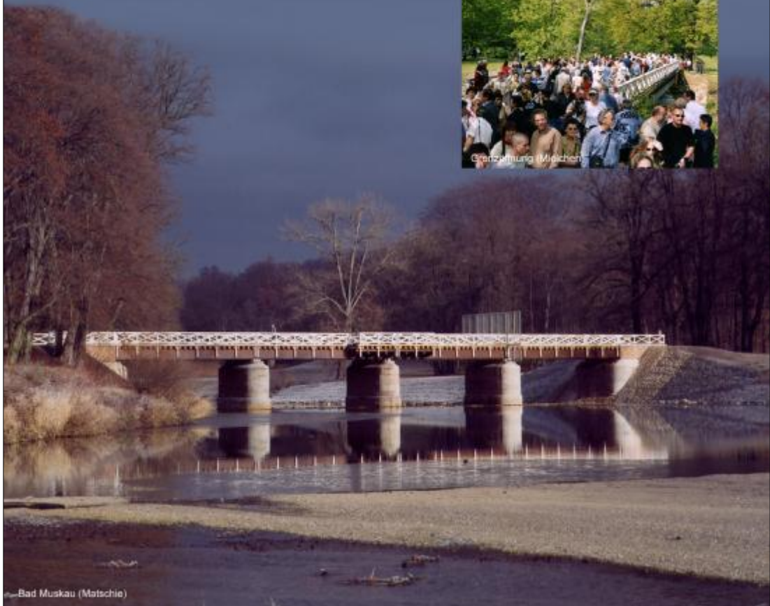
Bad Muskau (Matschie)