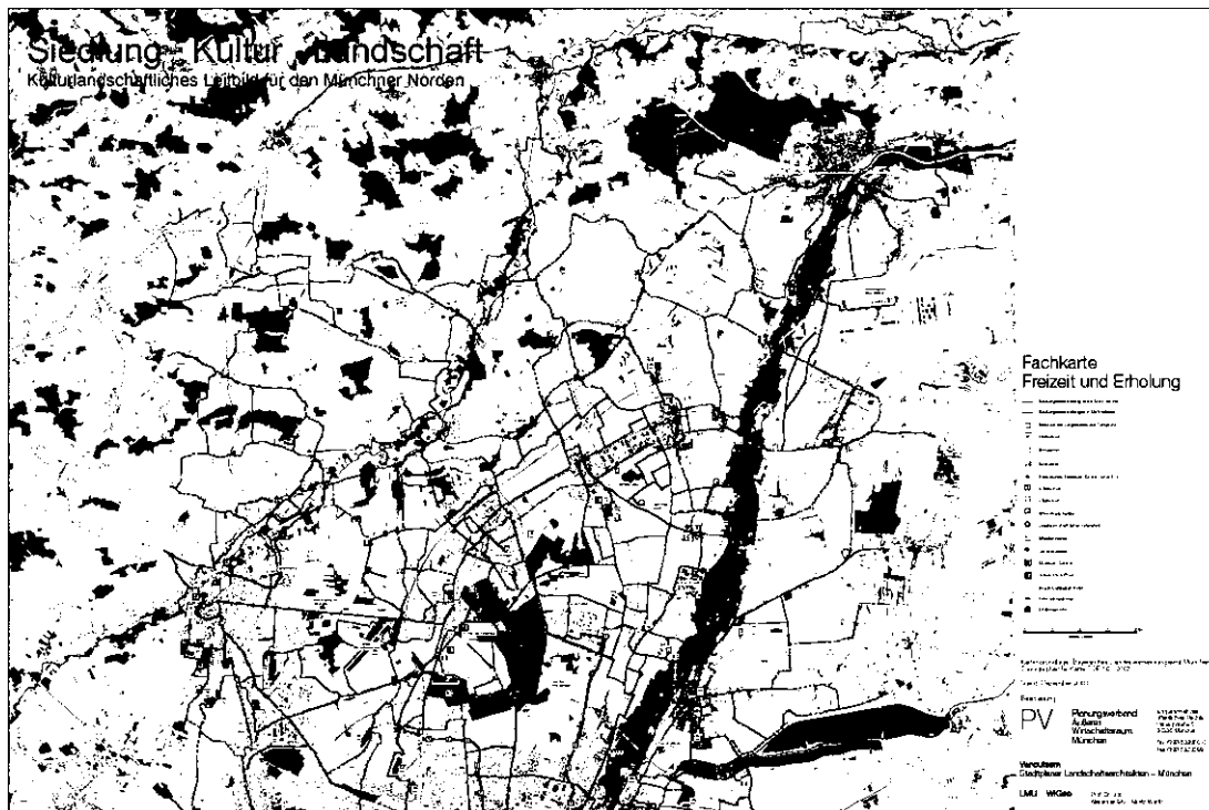
Beispiel einer Fachkarte: Freizeit und Erholung

Ziele des Projektes sind unter anderem die Erfassung, Beschreibung, Erklärung und Bewertung der im Münchner Norden vorhandenen kulturlandschaftlichen Strukturen. Hierzu werden Karten zu verschiedenen Schwerpunktthemen erstellt, die zu Potentialkarten zusammengeführt werden. Aus topographischen Karten unterschiedlicher Zeitabschnitte werden Landschaftswandelkarten generiert. Zusammen mit den Bestandskarten der Inventarisierung werden diese Grundlagen als Basis zur Aufstellung eines kulturlandschaftlichen Leitbilds herangezogen und Hilfen für die kommunalen Bauleitplanung sowie Vorschläge zum Kulturlandschaftsmanagement ausgearbeitet.